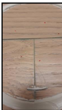
Nový SUMMIT 06(1,5mm fáze)